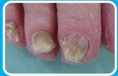
色が変わり、分厚く ポロポロになっている