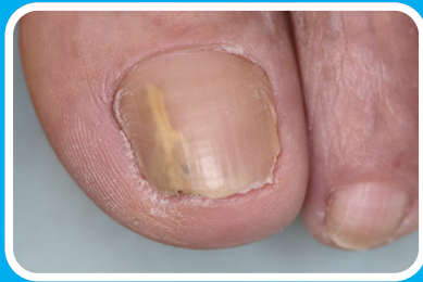
白～黄色の線が 入っている