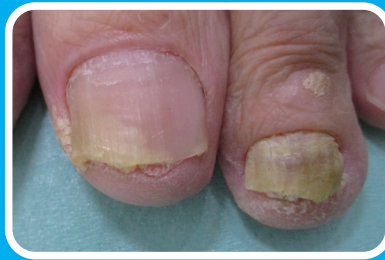
色が変わって 分厚くなっている